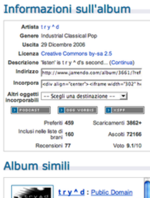
Figura 3: Far ascoltare un album a degli amici non è mai stato così semplice.

fa a conoscerti se non trova la tua canzone su MTV o alla radio? Non può. Prima ti ascolta, poi se ti apprezza ti ricompensa. E' la legge del mercato, domanda-offerta. Offri un servizio, vieni pagato per quel servizio, solitamente non è il viceversa (o almeno non dovrebbe esserlo). Jamendo si accolla tutti i costi di gestione e di distribuzione, in ritorno chiedo solo 50 centesimi per ogni donazione ricevuta. Potresti essere partito dal garage di casa ed essere arrivato ad essere un'icona a livello mondiale. Quando la comunità si riunisce le possibilità sono illimitate.