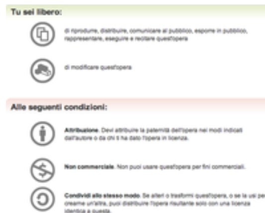
Figura 4: Una delle possibili licenze offerte da Jamendo e dalla Creative Commons.

Esistono numerosi esempi di artisti che hanno guadagnato grande successo grazie a Jamendo e grazie alle sue licenze Creative Commons. Deus ha pubblicato There's nothing impossible sotto la seguente licenza: