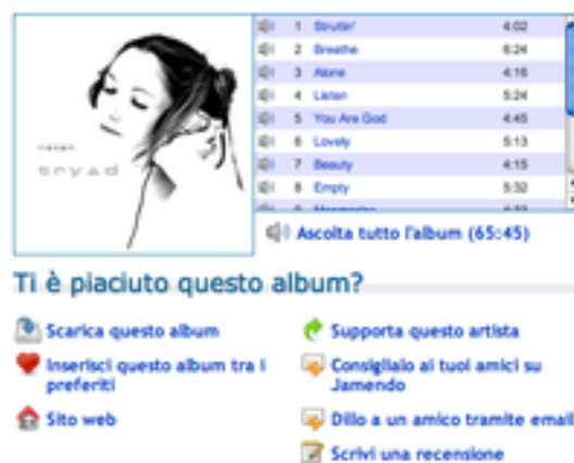
Figura 2: Ecco cosa offre Jamendo quando troviamo un album di nostro gradimento.

Il concetto è molto semplice: dare spazio e voce a tutti quegli artisti che hanno musica ed emozioni da offrire al mondo, ma che per qualche motivo non riescono a sfondare, spesso e volentieri perché non hanno le cosiddette amicizie di convenienza. Facciamo un esempio: sei un artista emergente, hai appena registrato un CD con la tua band, magari registrando nel garage di qualche amico, oppure sul tuo Mac/PC, oppure in una sala prove professionale, poco importa. Ciò che importa è che sei un artista e hai della musica, quindi ti chiedi come farla conoscere al mondo intero. Basta andare su Jamendo, caricare il CD, la copertina e fornire gli estremi del tuo conto. Jamendo penserà a tutto il resto. Gli utenti che si connettono al sito possono ascoltare in streaming la tua opera, scaricarla gratuitamente, consigliarla ad amici, scrivere una recensione e molto altro.